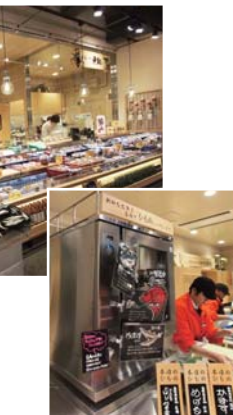
産地直送の魚を「活け干物」に 干物乾燥機