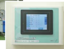
クリーンルーム内の室温をコントロールする集中温度制御盤