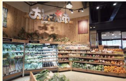
木のぬくもりを存分に活かした おひさん市

阪食様は、京阪神で「街中のマルシェ」をコンセプトに、出店攻勢を続ける企業です。フクシマでは、2015年2月2日にオープンした「阪急オアシス上本町店」の出店をサポート。店舗の半径500m圏は、30~40歳代の比率が35%、単身世帯数が51%と高いことから、売り場は、シニアをはじめ、感性の高い顧客層をターゲットにしたつくり。すぐに食べられる、少量、簡単、おいしいといった、単身世帯にも対応した商品群を強化しました。