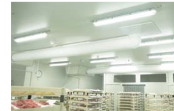
コールドドラフト対応のソックダクト