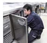
メンテナンス・サービス