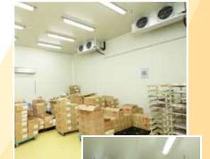
冷蔵設備はすべて福島工業製