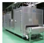
トンネルフリーザー