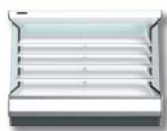
オープンショーケース